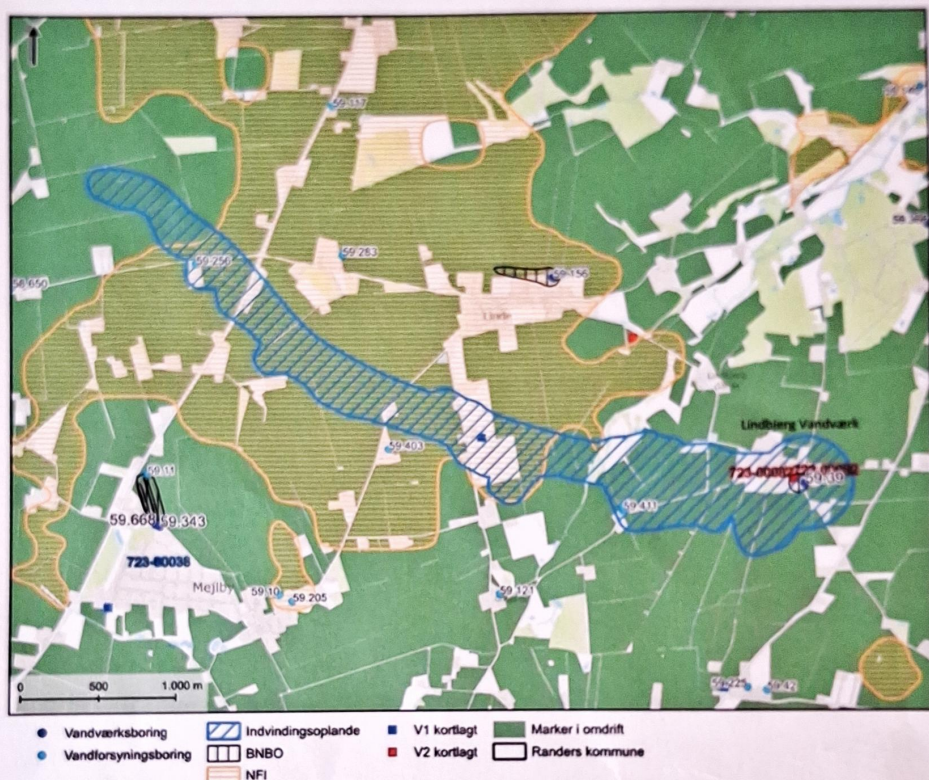
Figur 1 Indvindingsoplande, BNBO, nitratfølsomme indvindingsområder, dyrkede marker, øvrige indvindingsboringer og forureningslokaliteter